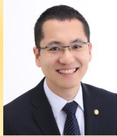
デジタル世代の引き継ぎノート

インターネットの普及に伴い、パソコンやスマホが不可欠な世の中となりました。一方で、これらのデジタル機器に保存されたデータやネットサービスのアカウント等(デジタル遺品)に関する問題をよく耳にするようになりました。このようなデジタル遺品に関する問題を「デジタル終活の普及」を通じて解決し、「相続で苦しめられる人が0になる」社会の実現を目指しています。