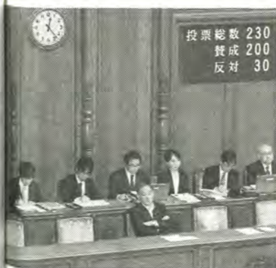
先の通常国会で成立した改正民法

特に妻の年齢が若い場合、夫と暮らした自宅を売却して、手頃な一人暮らし用マンションに引越そうと考えることもあり得る。「概ね六十歳以下の妻の場合、売却の出来ない居住権に縛られるよりも、所有権で売却も含めた選択肢を広