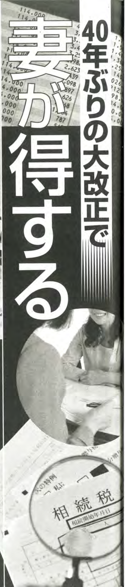
相続税も身近な問題