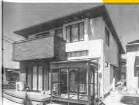
名義変更しないと相続人が増え手続きが煩雑になる

すし、不動産取得税もかかりません」 また、不動産の名義変更には期限や罰則がないため、相続したものの名義変更をしないケースも多いが、前出の山田氏は勧めないという。「何十年も経ってから、